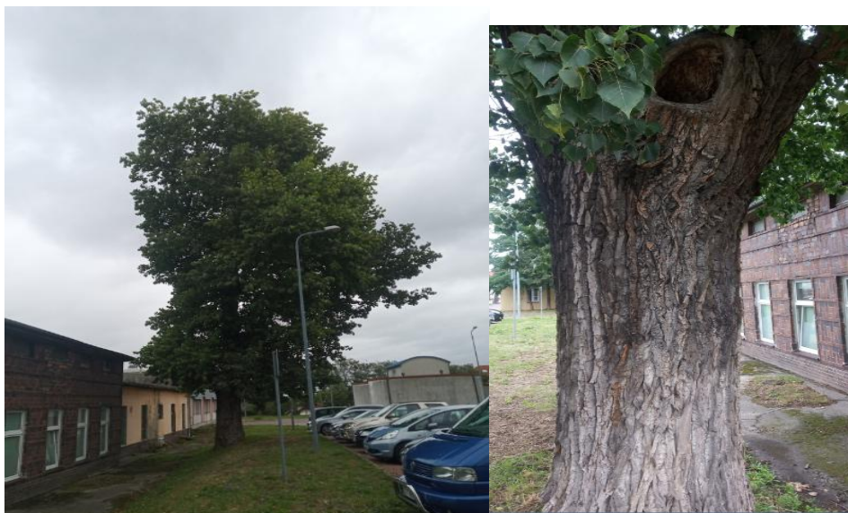
Zdjęcie Nr.2 do Zapytania ofertowego nr 12/ZO/2021

Topola - zlokalizowana obok budynku "G" w którym funkcjonuje Oddział Pediatryczny oraz przy parkingu dla samochodów pracowników i pacjentów szpitala. Widoczne otwory u podstawy pnia, dziupla na wysokości 3m oraz pęknięcie wzdłuż pnia na długości około 2m.