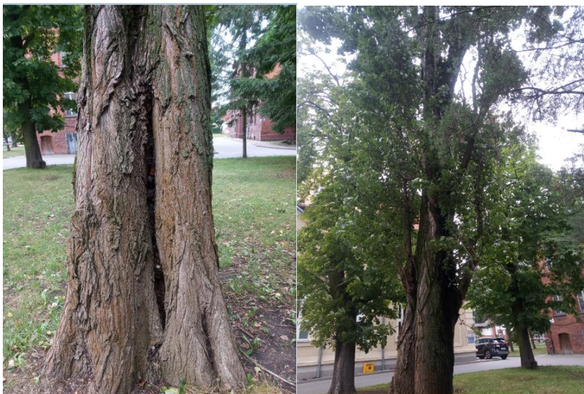
Zdjęcie Nr.1 do Zapytania ofertowego nr 12/ZO/2021

Topola włoska zlokalizowana przy budynku "N" w którym mieści się magazyn gazów medycznych oraz obok zbiornika na skroplony tlen.